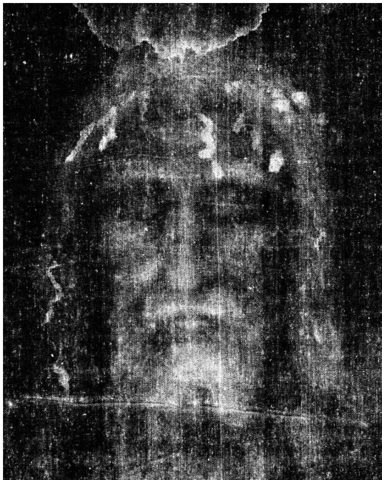
Il volto dell'Uomo della Sindone (negativo fotografico)