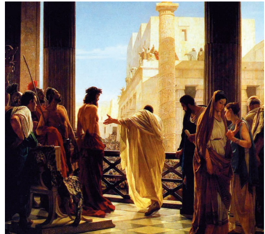
A PROCESSO. Cristo e Pilato nell'"Ecce Homo" di Antonio Ciseri (1821-1891)