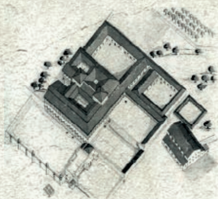
Ricostruzione della villa di Settefinestre, vista dall'alto (disegno di Sheila Gibson).

affreschi in secondo stile pompeiano. E c'è spazio per una terma, con ambienti riscaldati e vasche; perché la cura del corpo è un valore molto importante per i Romani. Insomma: qui si esibiscono il lusso e il potere, senza mezzi termini. Accanto alla parte urbana, un giardino porticato. Ancora piú a sud: un magazzino, un porcile e gli alloggi degli schiavi, tutti ambienti disposti intorno a un cortile centrale. Nella sua fase originaria la villa è un esempio della villa perfecta teorizzata da Varrone nel suo trattato De agricultura (I secolo a.C.). Innanzitutto, è ben servita dalle vie di comunicazione: la Via Aurelia, il mare. All'interno, un settore è dedicato all'autoconsumo; ma, al tempo stesso, la produzione della villa è fortemente rivolta verso il mercato esterno, specie quello di Roma. Tutto intorno si coltivano soprattutto vite e ulivo, e dunque la villa è dedita alla produzione di vino e olio: infatti è stato trovato un intero quartiere con i resti di svariati torchi, di un frantoio e di altri impianti destinati a queste attività. Con l'età di Traiano (98-117) la villa cambia proprietario, e la