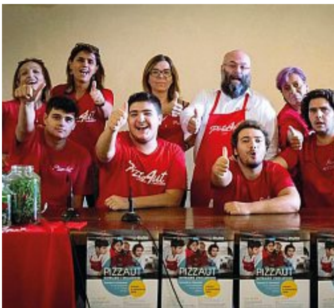
PizzaAut Il progetto prevede un laboratorio d'inclusione sociale con un locale gestito da ragazzi con autismo affiancati da professionisti