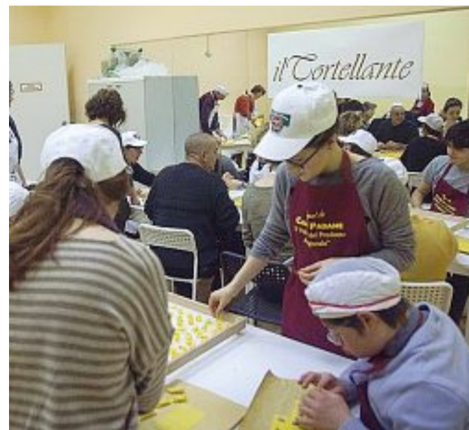
Tortellante È il laboratorio terapeutico-abilitativo di Modena: una vera e propria fabbrica artigianale di pasta fresca con ragazzi autistici