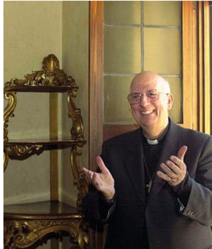
Il gesuita padre Bartolomeo Sorge (1929-2020)

Padre Sorge collaborò alla stesura dell'enciclica Octogesima adveniens , emanata da Paolo VI nel 1971 in occasione dell'ottantesimo anniversario della Rerum novarum di Leone XIII, che aveva segnato la nascita della dottrina sociale della Chiesa. Nel 1973 divenne direttore della «Civiltà Cattolica» e in questa veste svolse un ruolo di primo piano nelle vicende della Chiesa. Nel cli-